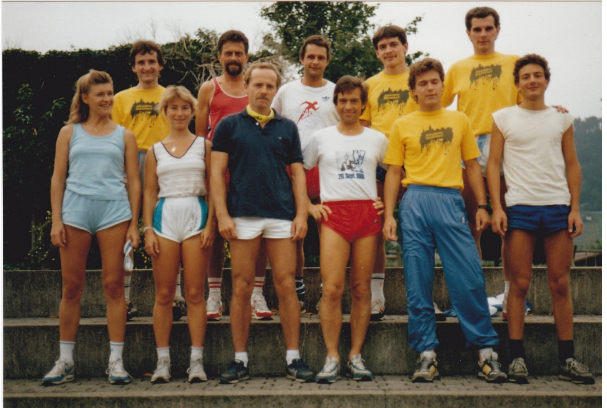
MILA 1987 Gruppenfoto